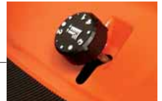
Molette de réglage de hauteur de coupe facilement accessible