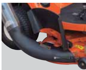
Obturateur ouvert avec bac de ramassage attaché

L'utilisation du bac de ramassage optionnel est maintenant plus facile que jamais. Son design innovant facilite la fixation de la goulotte, sans l'aide d'aucun outil. Une manipulation manuelle suffit pour attacher et détacher le bac selon vos besoins ponctuels en ramassage.