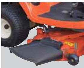
Obturateur ouvert pour l'éjection latérale

Avec ce mode de tonte, l'herbe coupée est évacuée uniformément et efficacement via la sortie latérale, sous l'impulsion des deux lames à rotation inverse. Le flux ici créé par ces lames, donne son nom 'Infinity' au plateau de coupe.