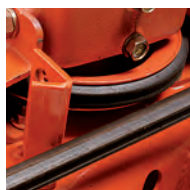
Courroie hexagonale extra-longue

(La courroie est toujours couverte par une protection.)