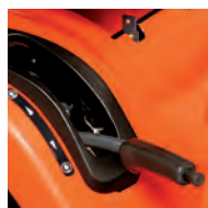
Levier de relevage tondeuse avec assistance