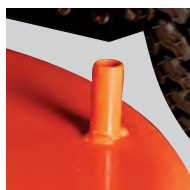
Dispositif de nettoyage du plateau pour le branchement d'un tuyau d'arrosage