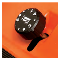
Molette de réglage de la hauteur de coupe facilement accessible