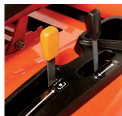
Commande de relevage hydraulique du plateau de coupe