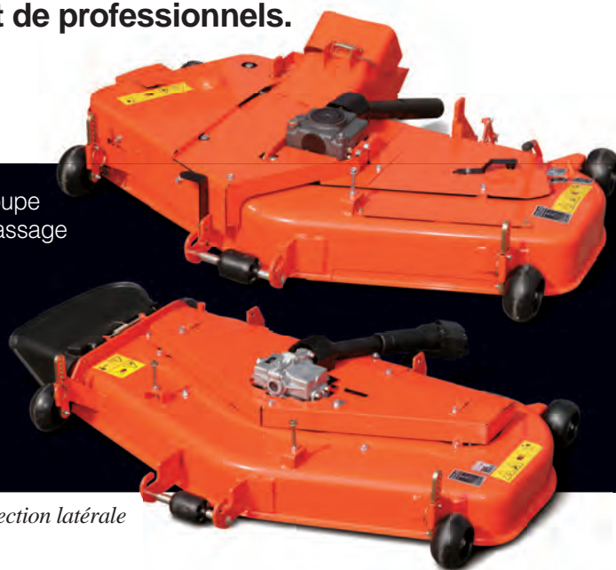
Plateau éjection latérale

Le système d'éjection directe des résidus de tonte garantit une coupe nette, et canalise leur évacuation instantanée dans le bac de ramassage intégré à l'arrière. La largeur de coupe de 1,22 m est parfaitement adaptée ; et en éjection arrière centralisée, la tonte serrée autour des arbres peut se faire aussi bien par la gauche que par la droite. Pour ceux qui préfèrent une éjection latérale, le plateau de coupe de la GR2120S est tout aussi performant et résistant, conçu en tôles épaisses, pour une profondeur de 12,7 cm. Vous obtiendrez donc toujours un résultat de professionnels quel que soit le système de coupe choisi, et cela saison après saison.