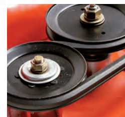
Courroie hexagonale extra-longue durée*

*Remarque: la protection de poulies et courroie, obligatoire et répondant aux normes de sécurité nationales, a été retirée à l'instant de la photographie pour une meilleure illustration.