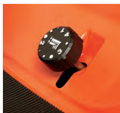
Molette de réglage de la hauteur de coupe facilement accessible