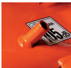
Dispositif de nettoyage plateau pour le branchement d'un tuyau d'arrosage