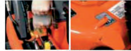
Pour nettoyer l'arrière du conduit.

En actionnant simplement un levier, une trappe élimine l'herbe qui pourrait s'accumuler dans le conduit et libère ainsi le passage vers le bac. Cette opération s'effectue rapidement sans que le conducteur quitte son siège.