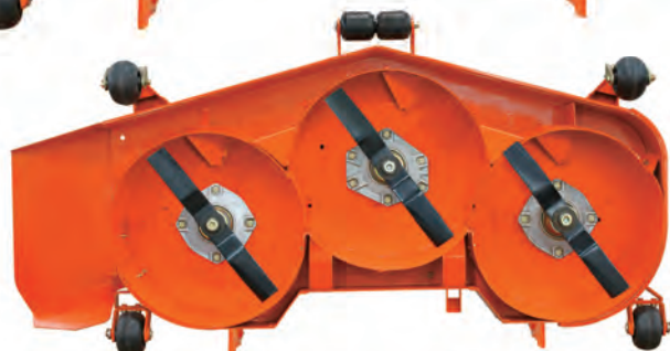
PLATEAU DE COUPE MULCHING (adaptation sur éjection latérale)

Le kit mulching a été totalement redessiné pour produire un broyat extrêmement fin et l'étendre uniformément sur la pelouse. Le résultat en est une pelouse parfaite, propre et uniforme. Le kit mulching peut être équipé aussi bien sur un plateau de coupe à éjection arrière qu'un plateau de coupe à éjection latérale.