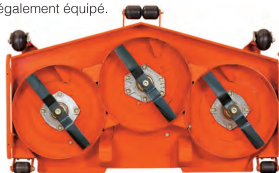
PLATEAU DE COUPE MULCHING (adaptation sur éjection arrière)