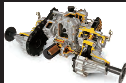
Transmission d'origine Kubota

Avec plus de 25 millions d'unités produites depuis 1922, les moteurs Kubota sont reconnus dans le monde entier pour leur qualité et leur fiabilité. Puissants, mais propres et peu bruyants, les moteurs diesel robustes de la série ZD vous offrent des performances, une productivité et une consommation inégalées. Les moteurs fiables de la série ZD vous permettent d'exécuter vos travaux de tonte avec facilité et efficacité. Ces moteurs à la pointe de la technologie sont également écologiques, grâce à une faible consommation, une combustion plus efficace et de bas niveaux de vibrations et de bruit. Ces moteurs sont associés à la transmission hydrostatique d'origine Kubota qui offre des reprises plus rapides et plus souples dans toutes les conditions de charge. À l'exception des changements de liquide occasionnels, la structure étanche n'a besoin d'aucun entretien et d'aucun changement de courroie.