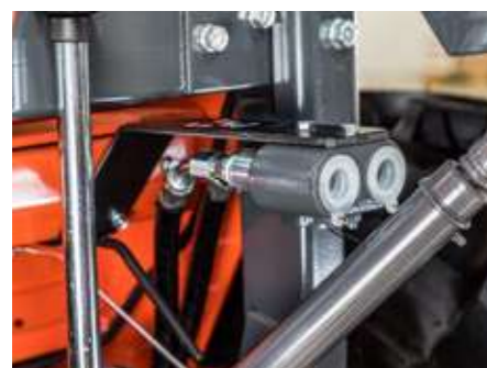
* Distributeur arrière simple effet

Le relevage arrière permet d'ouvrir de nombreuses possibilités d'utilisation de combinaisons d'outils différentes. En cas de besoin, les bras de levage peuvent être repliés vers le haut, par exemple pour augmenter la garde au sol.