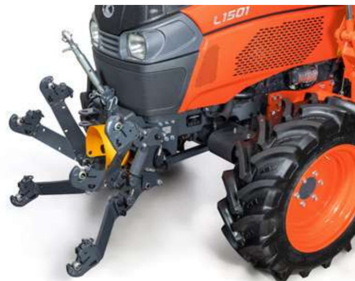
* Relevage avant non disponible