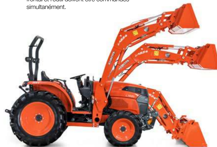
* Relevage avant non disponible

Le chargeur frontal vous facilite le travail même le plus difficile. La commande moderne par joystick est pratique et efficace même lorsque le chargeur frontal et l'outil doivent être commandés simultanément.