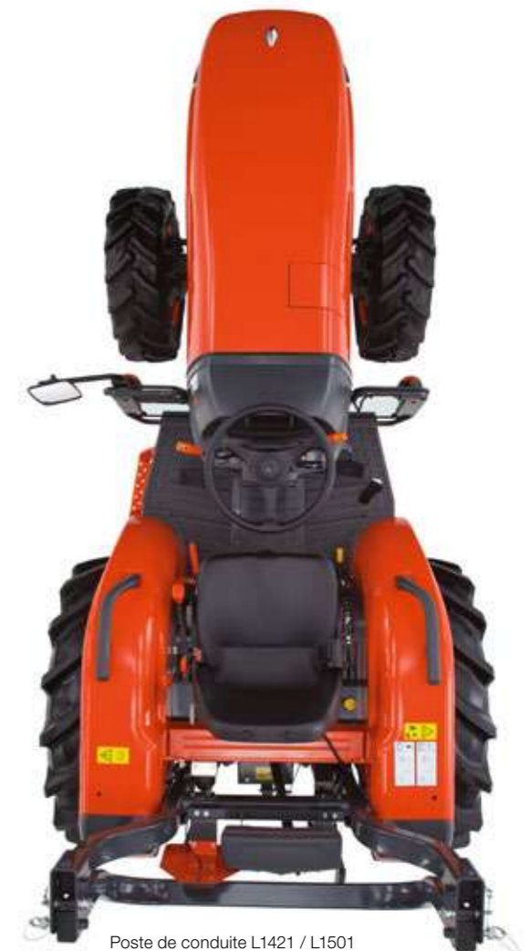
Poste de conduite L1421 / L1501

Les freins à disques humides des tracteurs réagissent à la moindre pression du pied et assurent un freinage uniforme. Les disques de frein, fonctionnant dans un bain d'huile, sont extrêmement durables et résistants à l'usure.