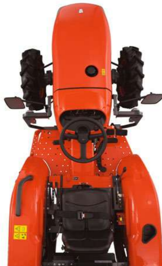
Poste de conduite L1361