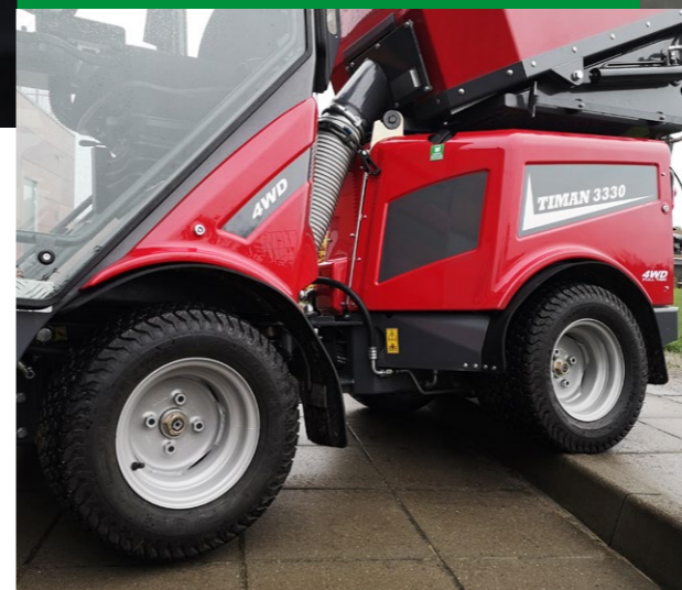
Châssis à ressort

Avec des amortisseurs absorbant les chocs sur les quatre roues, le Timan 3330 vous offre l'expérience de conduite la plus silencieuse et la plus confortable du marché, et ce même sur terrain accidenté.