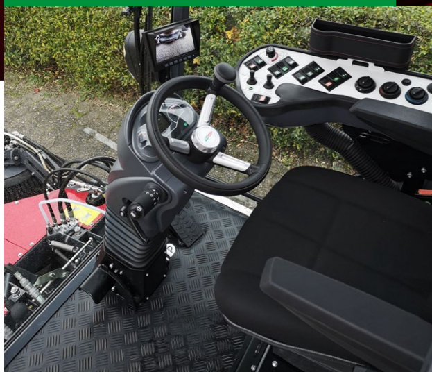
Faible niveau sonore et beaucoup d'espace

Oubliez votre casque de protection auditive et écoutez de la musique. Avec seulement 68 dB à 2600 tours, dans une cabine spacieuse et climatisée, le travail stressant et inconfortable n'existe plus. Une nouvelle pédale très pratique permet de changer facilement le sens de la marche.