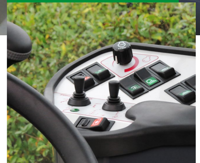
Commande intégrale à portée de main

Le panneau de commande du Timan 3330 a été développé en collaboration avec les utilisateurs quotidiens. Car une commande intégrale doit fonctionner de façon naturelle. Le régulateur de vitesse, l'accélérateur manuel électronique et le système d'arrêt et de démarrage font partie de l'équipement standard de la machine.