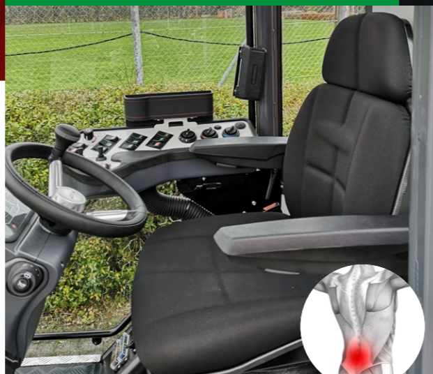
Siège conducteur entièrement réglable

Fini les douleurs lombaires. La hauteur réglable, l'appui du dos et le design ergonomique garantissent un confort maximal d'assise.